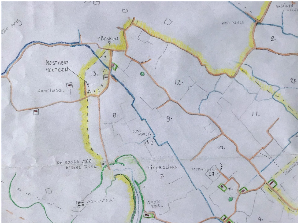
Kaart van ca 1912, geel is de grens van het ambacht Nieuwerkerke. In het groen omcirkeld blok 10 lag Nieuwerkerke met kerk en werf (terp) en de ruine (de steenrotse) van het kasteel. Dit en noord-westelijk werd de de Steenhoek genoemd, zuidwestelijk de Oosthoek van Nieuwerkerke. In 1817 verloor het ambacht heel wat grond en in 1873 kwam het Arnekanaal gereed, met aan weerszijden hoge dijken. De oude Arne stelde toendertijd amper nog wat voor. Gelijk vond de aanleg plaat van de spoorlijn, zodoende veranderde het landschap behoorlijk! De 4 donkergroene stippen zijn terpen of werden werven genoemd.

Pauwels Adriaens blocq. ( / uit index org. 3000-275) 19 percelen, somma 46 gem. 81 roeden